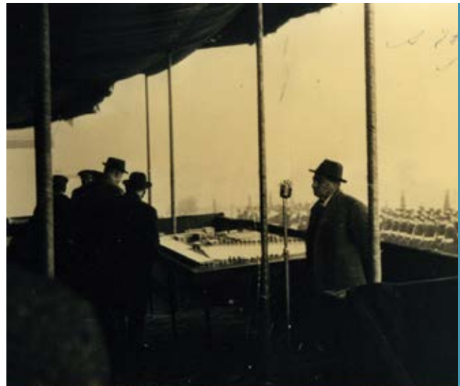
ROMA, 5 FEBBRAIO 1964. S.E. PARILLI ESAMINA IL PLASTICO DEL NUOVO CENTRO DI IDRODINAMICA. IL CAPO DELLO STATO SEGNI, PONESSE LA PRIMA PIETRA DELLA NUOVA VASCA