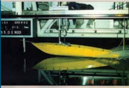
La Vasca Navale di Roma si carpiscono i segreti delle onde e del vento. È nato il Moro di Venezia, qui sono testate le motovedette dell'Arma