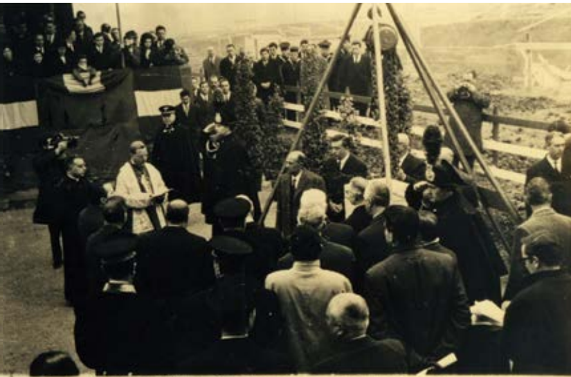
IL CAPO DELLO STATO, PRESIDENTE SEGNI, PONE LA PRIMA PIETRA DELLA NUOVA VASCA NAVALE DELL'ISTITUTO DI ARCHITETTURA NAVALE ED INAUGURA IL CENTRO DI ESPERIMENTI IDRODINAMICI. ROMA, 5 FEBBRAIO 1964.