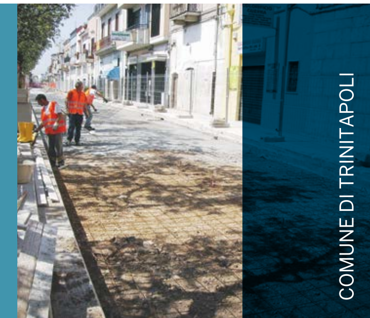
Sistemazione di Viale Vittorio Veneto con realizzazione di nuova condotta pluviale.