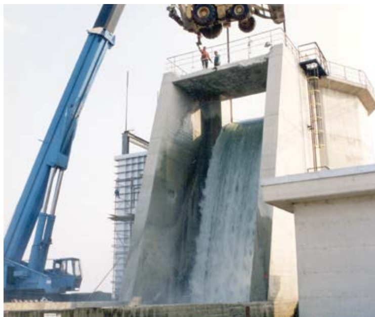
Realizzazione centrale idroelettrica del Sinni località Ginosa, Taranto.